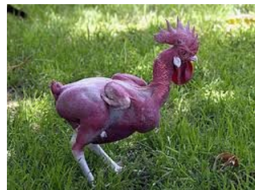
2. De gouden eieren van de kip, naast de kale geplukte kip!