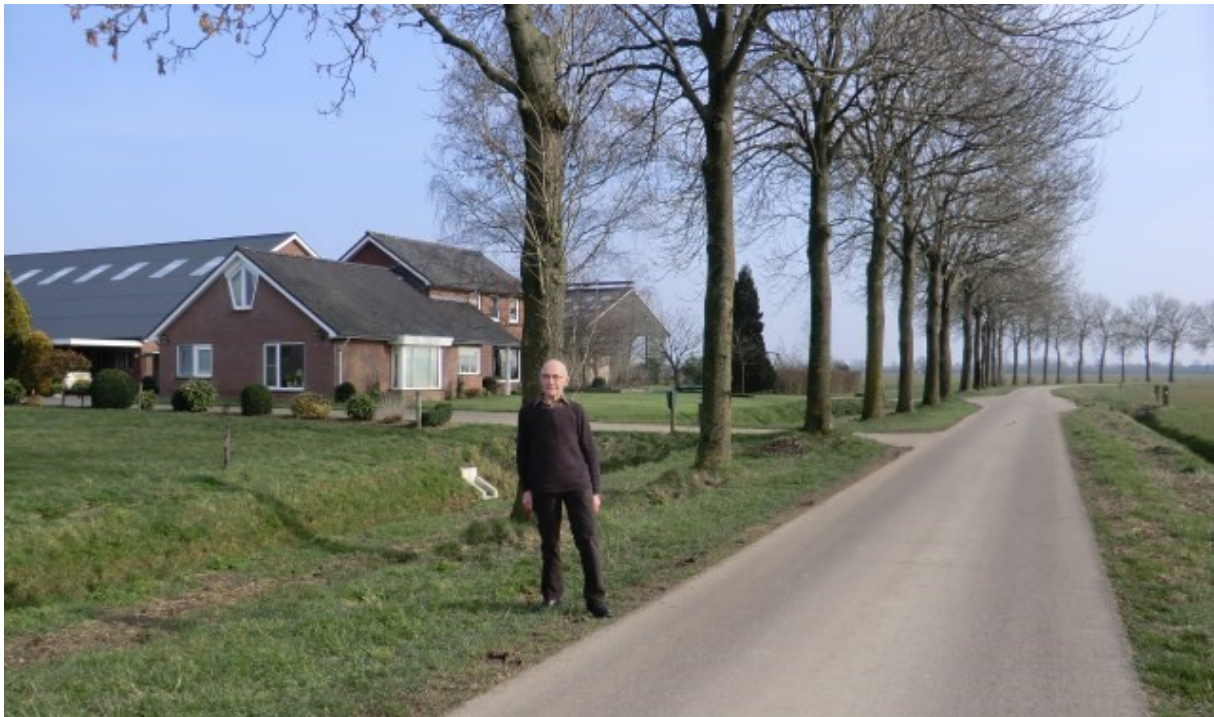
Een ruilverkaveling landschap

En zo werd Nederland een aangeharkt land.