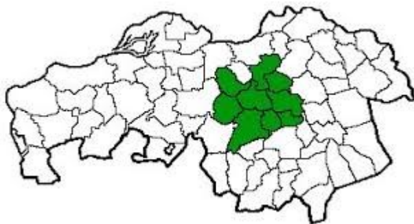
Het Groene Woud op de kaart van Brabant