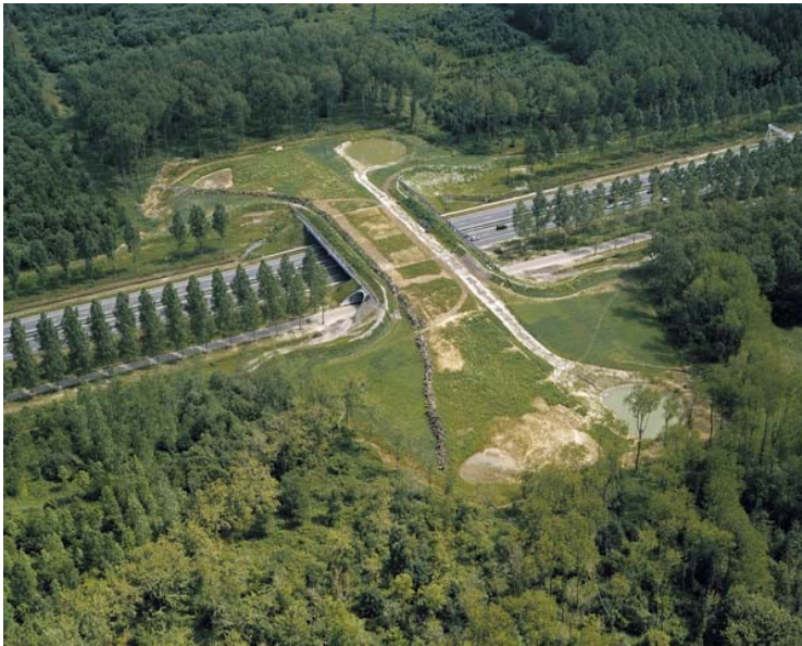
1 De Natuurbrug over de A2 gezien vanuit het westen.

Er is een ruwe begrenzing van de stedendriehoek (zie kaartje hiervóór) en een nauwkeurige begrenzing op perceel niveau. Die laatste begrenzing komt uit het officiële beleid rond Nationale Landschappen. Deze grenzen zijn vastgelegd door de provincies.