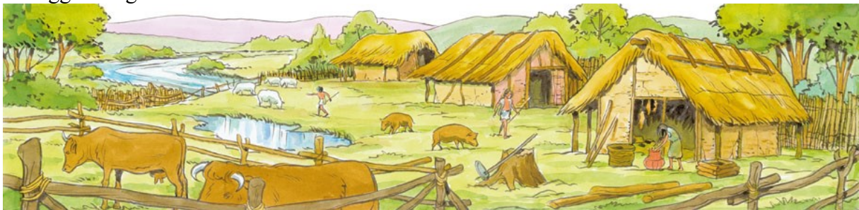
De eerste boeren rond 4000 voor Christus

Rond 1.500 voor Christus was de helft van ons land daarmee bedekt. Ondertussen maakte de mens de overstap van jagen en verzamelen naar de landbouw. Dat betekende dat boeren bomen kaptten om akkertjes, weilanden en hooilanden te maken. Het hout gebruikten ze om boerderijen te bouwen en eten te koken. Ze plantten heggen, hagen en houtwallen aan om veen tegen wild te beschermen. Vanaf de tiende eeuw gingen ze, vaak samen met monniken, dijken aanleggen langs de kust om land te winnen.