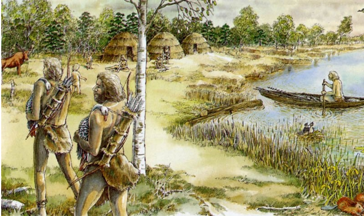
Jagers en verzamelaars rond 6000 voor Christus

Het begon bij de grote oerkrachten van de natuur. Nadat tienduizend jaar geleden de zeespiegel steeg, Engeland een eiland werd en de mammoet uitstierf, legden oerrivieren de basis voor onze delta. Toen dat proces wat tot rust kwam, heeft zich in de duizenden jaren die volgden een enorm pakket veen gevormd.